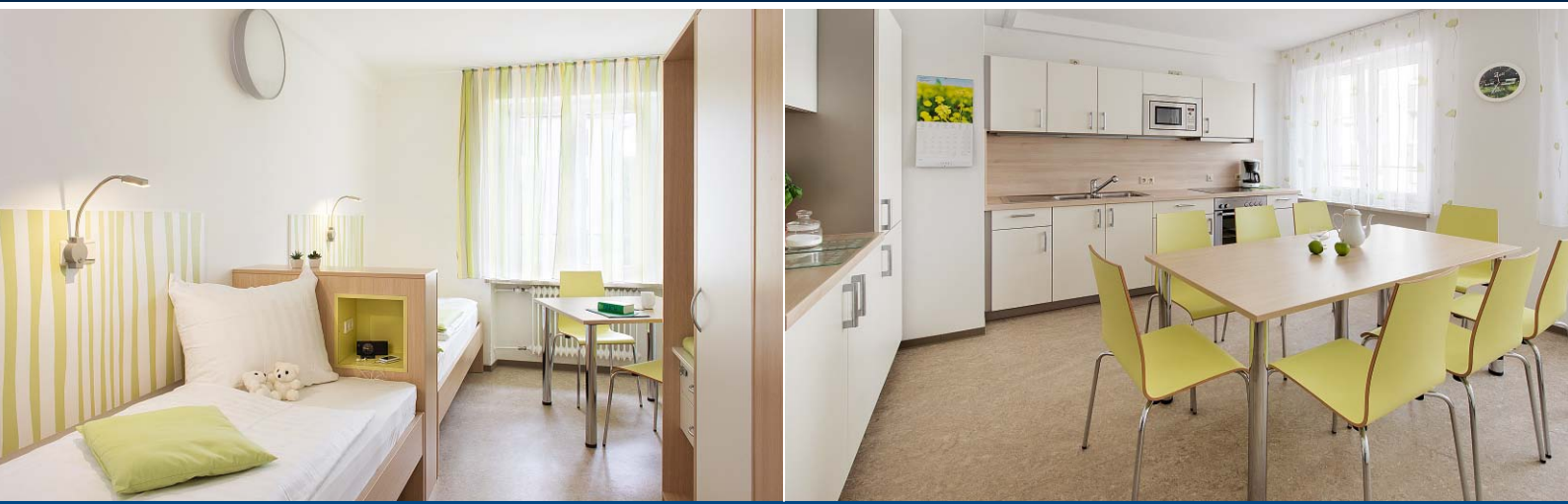
Doppelzimmer: Freundlich-leichtes Design – hier in der „grünen Etage“