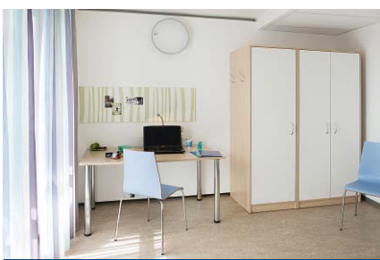
Bewohnerzimmer in der „blauen Etage“

Für die 29 Dauerbewohnerinnen wurden Stauraummöglichkeiten unter dem Bett geschaffen, die Kleiderwäscheschränke sind je nach Nutzungsbereich (Blockschülerin/Dauerbewohnerin) unterschiedlich ausgestattet. Die Sofas in den Dauerwohnerräumen können schnell zu weiteren Betten umgestaltet werden. Die Beleuchtung in den Zimmern wurde auf die Bedürfnisse der Mädchen abgestimmt. Die Leseleuchte ist biegsam und die Deckenbeleuchtung in zwei Intensitätsstufen schaltbar: intensiv als Arbeitslicht und gedämpft für den gemütlichen Aufenthalt.