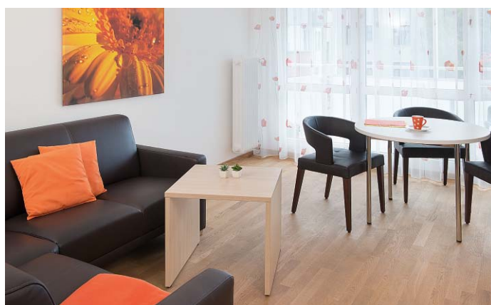
Aufenthaltsraum zum Studieren und Relaxen