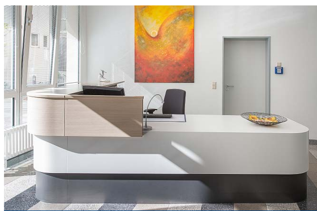
Foyer: Moderne Theke passend zum Granitboden