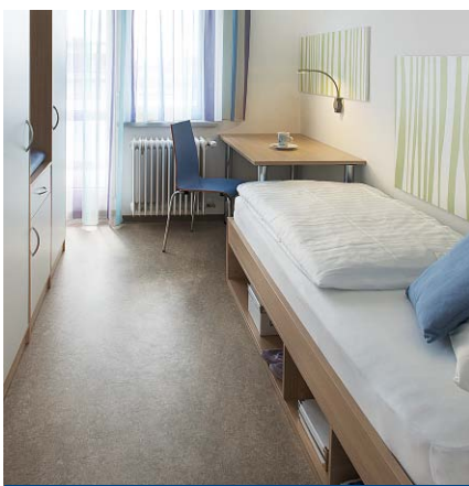
Einzelzimmer: Stauraum unter dem Bett

Für die 29 Dauerbewohnerinnen wurden Stauraummöglichkeiten unter dem Bett geschaffen, die Kleiderwäscheschränke sind je nach Nutzungsbereich (Blockschülerin/Dauerbewohnerin) unterschiedlich ausgestattet. Die Sofas in den Dauerwohnerräumen können schnell zu weiteren Betten umgestaltet werden. Die Beleuchtung in den Zimmern wurde auf die Bedürfnisse der Mädchen abgestimmt. Die Leseleuchte ist biegsam und die Deckenbeleuchtung in zwei Intensitätsstufen schaltbar: intensiv als Arbeitslicht und gedämpft für den gemütlichen Aufenthalt.