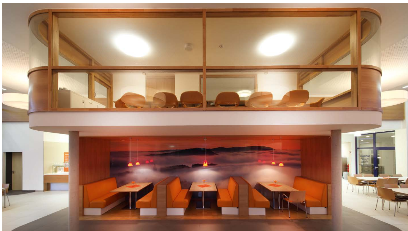
Die Empore mit Aufenthalts- und Meetingraum im oberen Bereich sowie einer gemütlichen Sitzzecke darunter

► Siehe auch Projektbericht Nr. 30 „Komfortzimmer“ im St. Georg Klinikum Eisenach