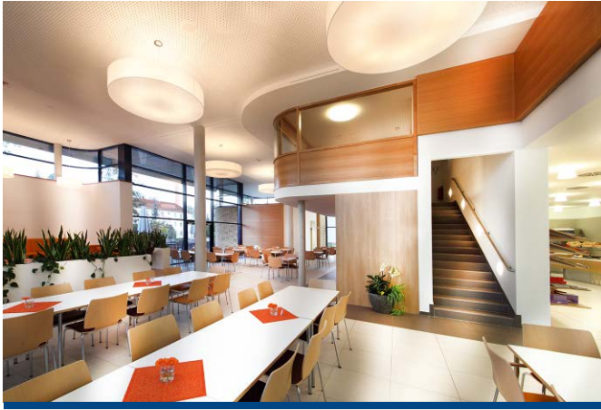
Eine flexible Bestuhlung ermöglicht große Tafeln