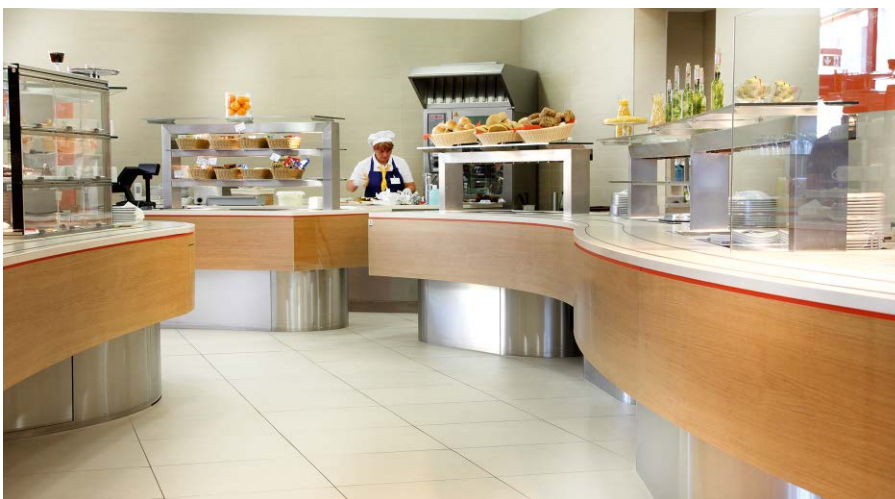
Großzügige, geschwungene Ausgabetheke

www.wibu-objekt.de – einfach in der Karte rechts auf den Standort klicken und anrufen!