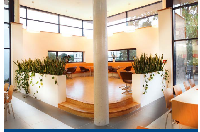
Die Cafeteria ist in verschiedene Zonen aufgeteilt

Charakter“ wird bewusst vermieden. Durch eine sogenannte flexible Bestuhlung können auch bequem große Tafeln gestellt werden. Der Loungebereich mit seinen Sitzbänken unter der Empore erinnert ein wenig an amerikanische Restaurants. Die gesamte Empore ist mit Eichendekor verkleidet, der Boden in der Lounge unter der Empore wurde mit Eichenparkett ausgestattet. Für die Sitze der Loungemöbel hat man sich für ein modernes Kunstleder entschieden, das in seiner edlen Oberflächenbeschaffenheit kaum von einem echten Leder zu unterscheiden ist. Die Terrasse lädt mit einer modernen Bestuhlung und großen, windfesten Sonnenschirmen zum Entspannen ein.